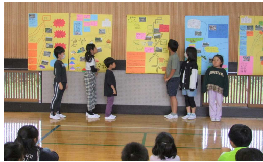
5/8 出来上がったマップを使って発表

今回の活動から、地域の危険な箇所と安全な場所(あんしん家)を理解して、安全に登下校して欲しいと思います。