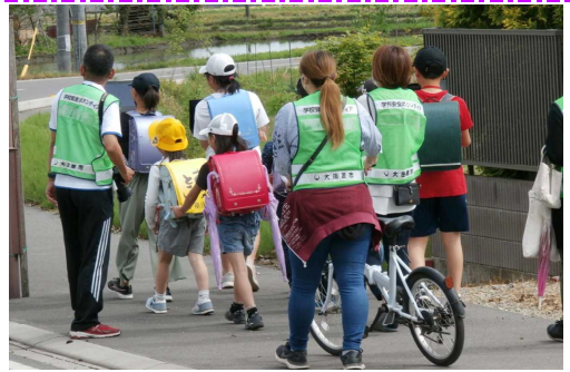
4/30 危険箇所を考えながらの下校

3回目は、地域安全マップづくりを行い、その様子はとちぎテレビでも放映され、下野新聞にも掲載されました。