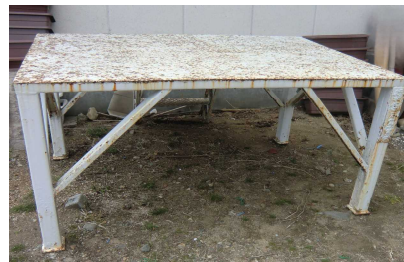
「贈昭和四十年卒業」の文字有