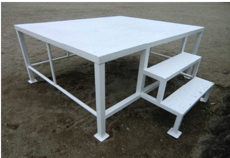
ペンキを振り直した福原小からの朝礼台

本校の朝礼台は、昭和40年度卒業生の皆様が、卒業記念品として贈呈してくださった物です。しかし、寄贈いただいてから約60年が経ち、腐食が激しく安全に使用するには不安がありました。そこで、閉校となっている福原小学校から譲り受けました。これも、昭和63年度の卒業記念品として贈呈された物で、サビが出ていたため、新しくペンキを塗り直して使用を始まりました。5月29日(水)の運動会で、ご覧いただけたらと思います。