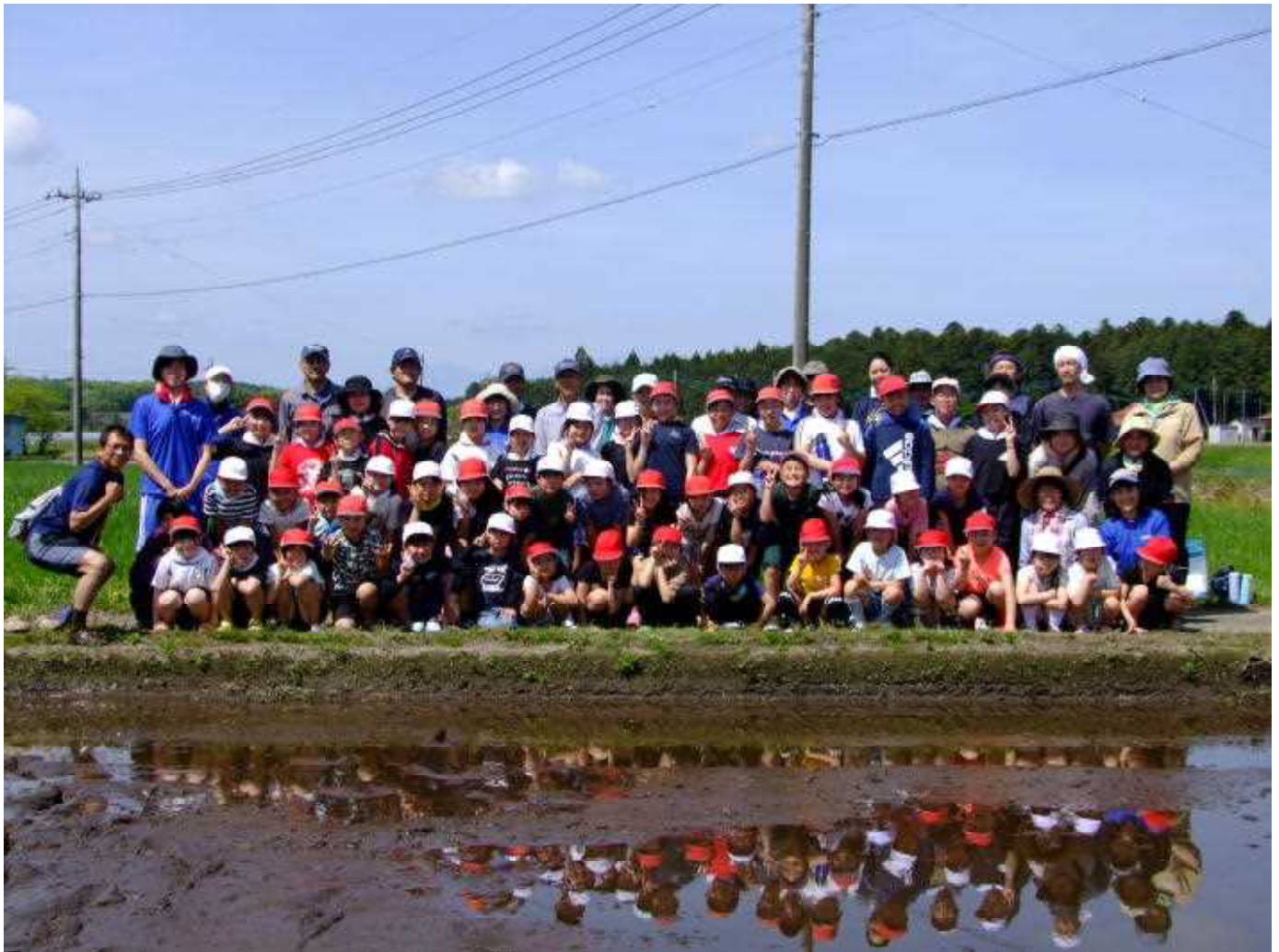
晴天の田植え日和！ 多くの方々に支えられての田植えでした。どろの感触も気持ち良かったですね！

これから収穫の秋まで、前田牧場様には管理をお願いいたします。子どもたちにも、成長の様子を見守ってほしいと思います。御協力いただいた皆様、大変ありがとうございました。