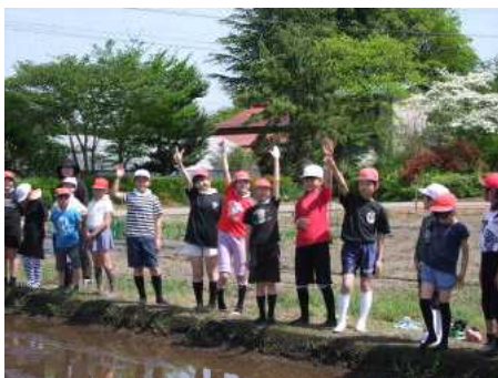
これから田植えを始めます！