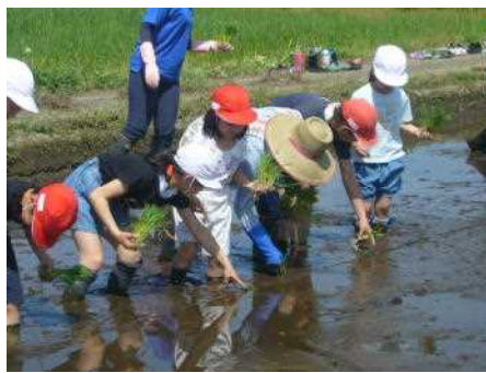
「ここに植えるよ。」優しく教える6年生