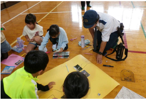
5/8 班で話し合いながら安全マップ作り