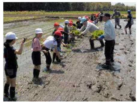
「苗ください！」子どもたちは意欲的