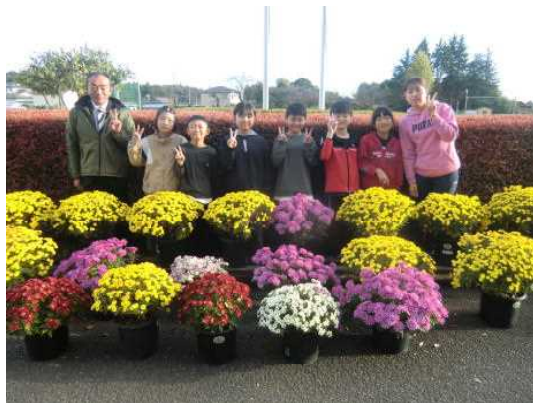
満開の菊の花と4年生の子供たち

11月には大田原市産業文化祭を始め、金田地区文化祭なども開かれて、子供たちの作品をご覧いただく機会があったかと思えます。4年生が育てた菊鉢も菊花展に出品されました。金丸菊の会の皆様には、大変お世話になりました。見事な花を咲かせています。