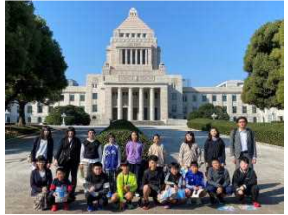
10/26・27修学旅行 国会議事堂

5年生による学校田のお米の精米・販売準備等には、広報・研修部の方が御協力くださるなど、皆様のお力で学校の様々な活動を滞りなく実施することができました。重ねて御礼申し上げます。