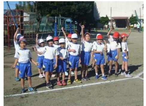
マラソン大会 低学年スタート!