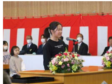
立派だった6年生代表あいさつ

が多く見られます。1年生の頑張りにつられて、上級生達も徒歩通学に取り組んでいます。