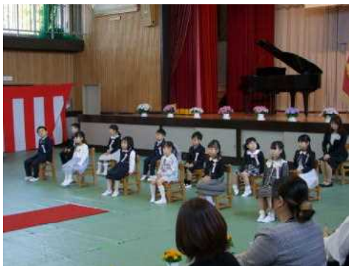
本校で一番人数の多い学年です。