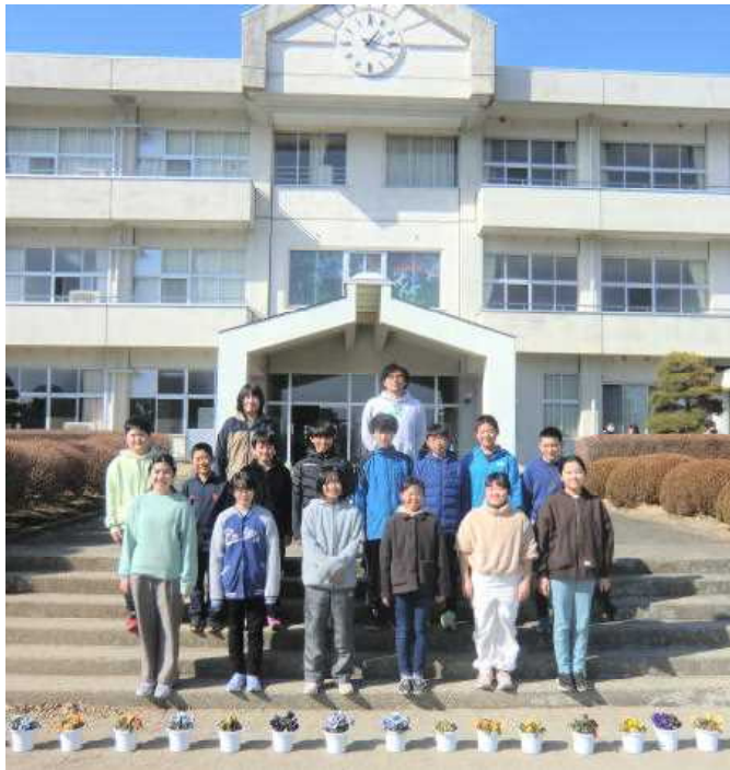
R5年度 14名の卒業生のみなさん